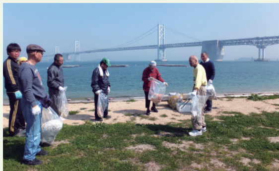
坂出市ナカダ浜で地域清掃活動

清水園は、利用者、利用者の家族、地域住民の幸せを求めて取り組んでいきます。平成27年度を地域貢献元年と位置付け、施設の開放を実施し、地域の方々と交流を深めます。