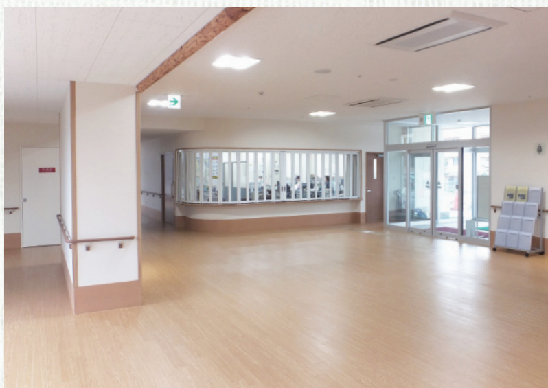
広々とした玄関ホール