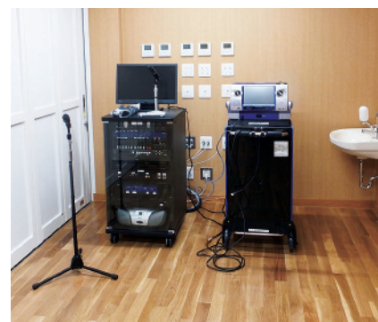
音響設備と通信カラオケ